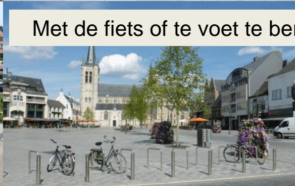
Met de fiets of te voet te bereiken