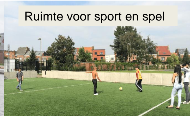
Ruimte voor sport en spel